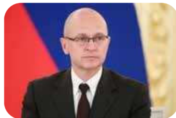
С.В. Кириенко – Первый заместитель Руководителя Администрации Президента Российской Федерации