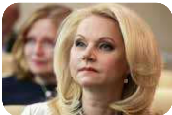
Т.А. Голикова – Заместитель Председателя Правительства Российской Федерации