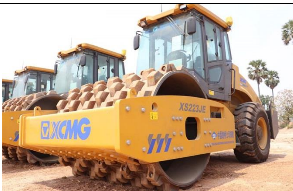
КАТОК ДОРОЖНЫЙ XS233JEPD

Рабочий вес: 22 000 кг Ширина укладываемого полотна: 2130 мм Частота колебаний: 28/33 Гц Общие габариты (Д*Ш*В): 6220×2390×3200 мм Амплитуда колебаний: 1.86/0.93 мм Центробежная сила: 374/290 кН Мин. радиус поворота: 6500 мм Преодолеваемый подъем: 30% Колесная база: 3180 мм Диаметр вибрационного колеса: 1600 мм Минимальный дорожный просвет: 440 мм Двигатель: Shanghai SC8D185 Мощность двигателя: 136 кВт/185 л/с Тип двигателя: дизельный Ведущая ось: XCMG Размер шины: 20.5-25-16PR Кол-во кулачков: 150 шт Высота кулачков: 100 мм Кол-во колес: 2 шт Давление вибрационной системы: 35 Мпа Комплектация: кондиционер, система холодного запуска, ЗИП ящик, съемный кулачковый